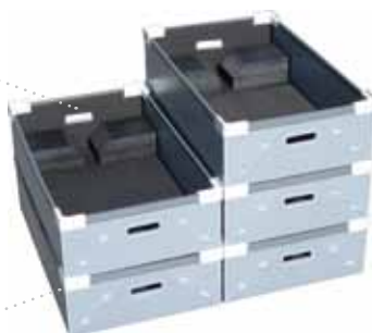
Coins de gerbage